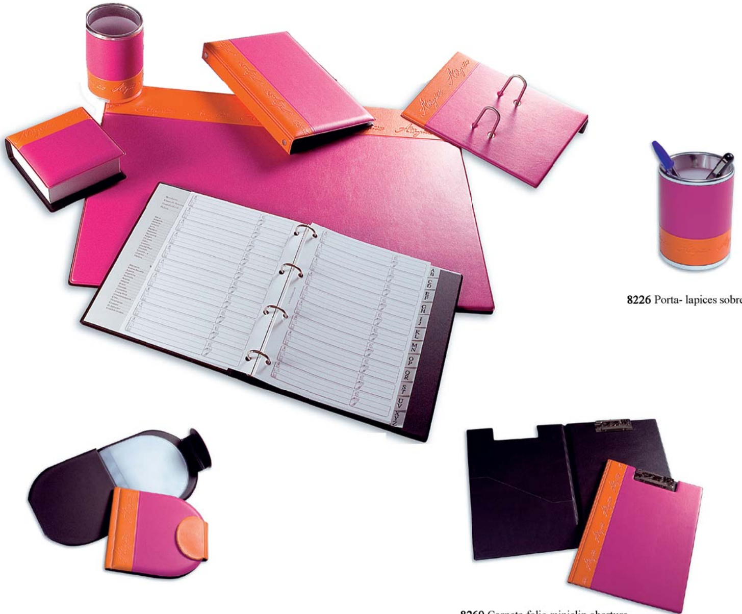
8226 Porta- lapices sobremesa.