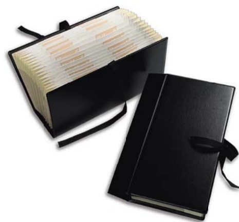
3178 Clasificador A-Z tamaño recibos con cintas.