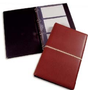
4121 Tarjetero 4 anillas 10 fundas.