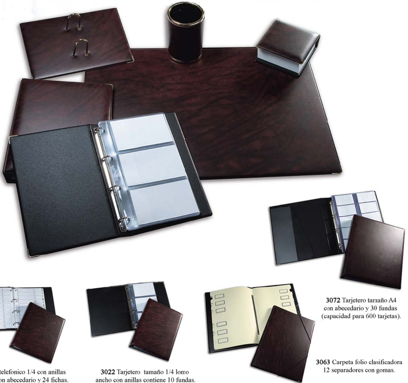
3015 Listin telefonico 1/4 con anillas lomo ancho con abecedario y 24 fichas.