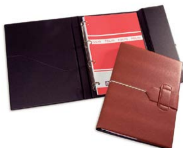
4165 Carpeta folio 4 anillas solapa pasador.