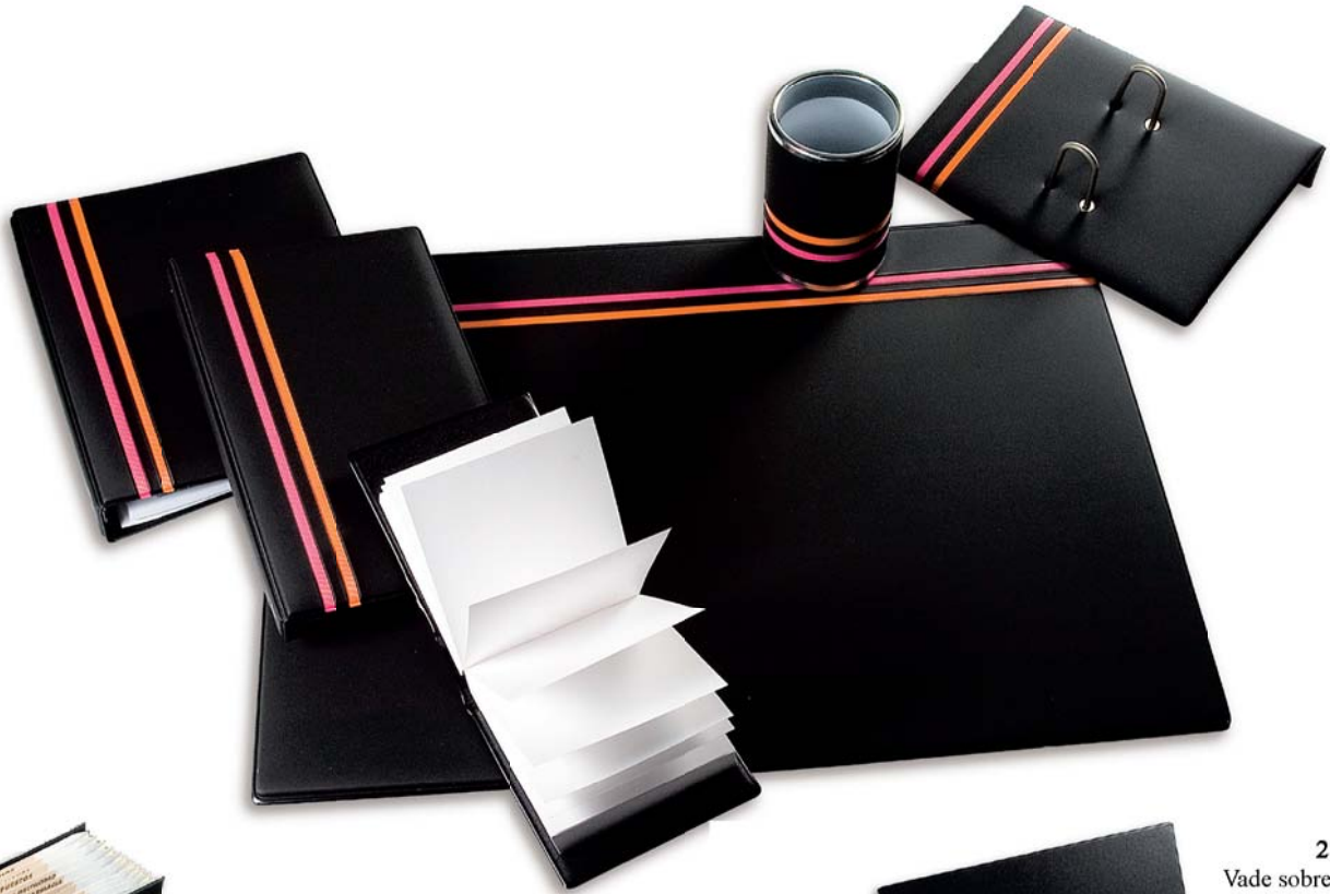
2876 Clasificador A-Z cuarto.