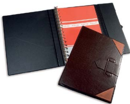
9667 Carpeta folio 16 anillas solapa y pasador.