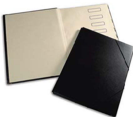
3164 Clasificador fuele folio 8 departamentos con gomas.