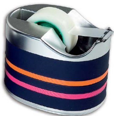
2729 Porta celo