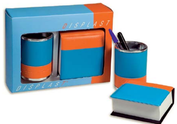
8153 Set 2 piezas Porta-lapices y Porta-notas.