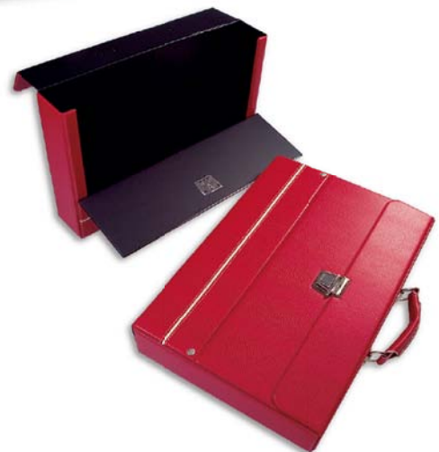
4030 Maletin ejecutivo 38 x 28 x 8.