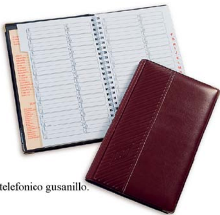
2006 Listin telefonico gusanillo.