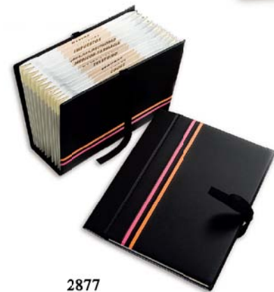
2877 Clasificador hogar cuarto.