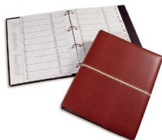
4105 Listin telefonico anillas.