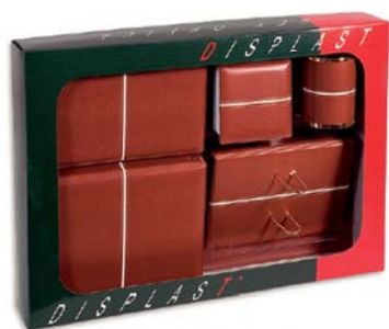
4152 Set 6 piezas.