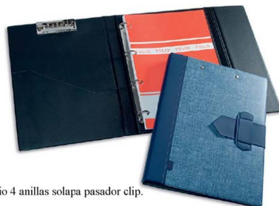
2166 Carpeta folio 4 anillas solapa pasador clip.