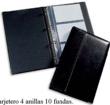
2621 Tarjetero 4 anillas 10 fundas.