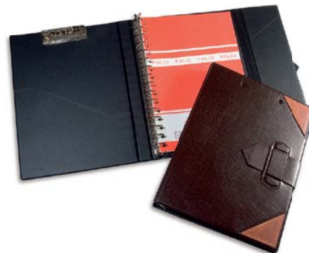
9668 Carpeta folio 16 anillas solapa y pasador clip.