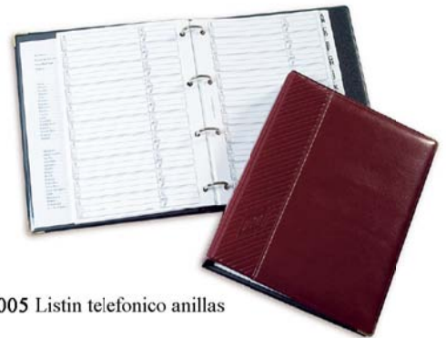
2005 Listin telefonico anillas