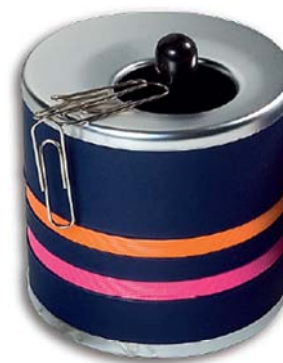
2728 Porta clips.