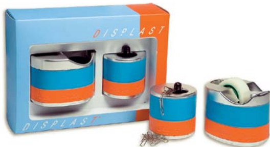
8154 Set 2 piezas Porta-clips y Porta-celo.