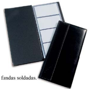
2620 Tarjetero 20 fundas soldadas.