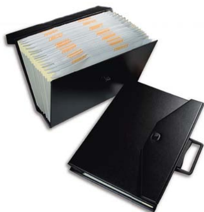
3170 Clasificador A-Z folio con asa solapa y broche de plastico.