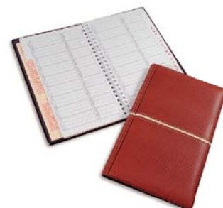
4106 Listin telefonico gusanillo..