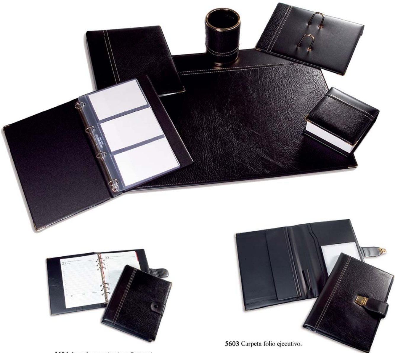
5604 Agenda perpetua tamaño cuarto (descatalogada en esta coleccion)