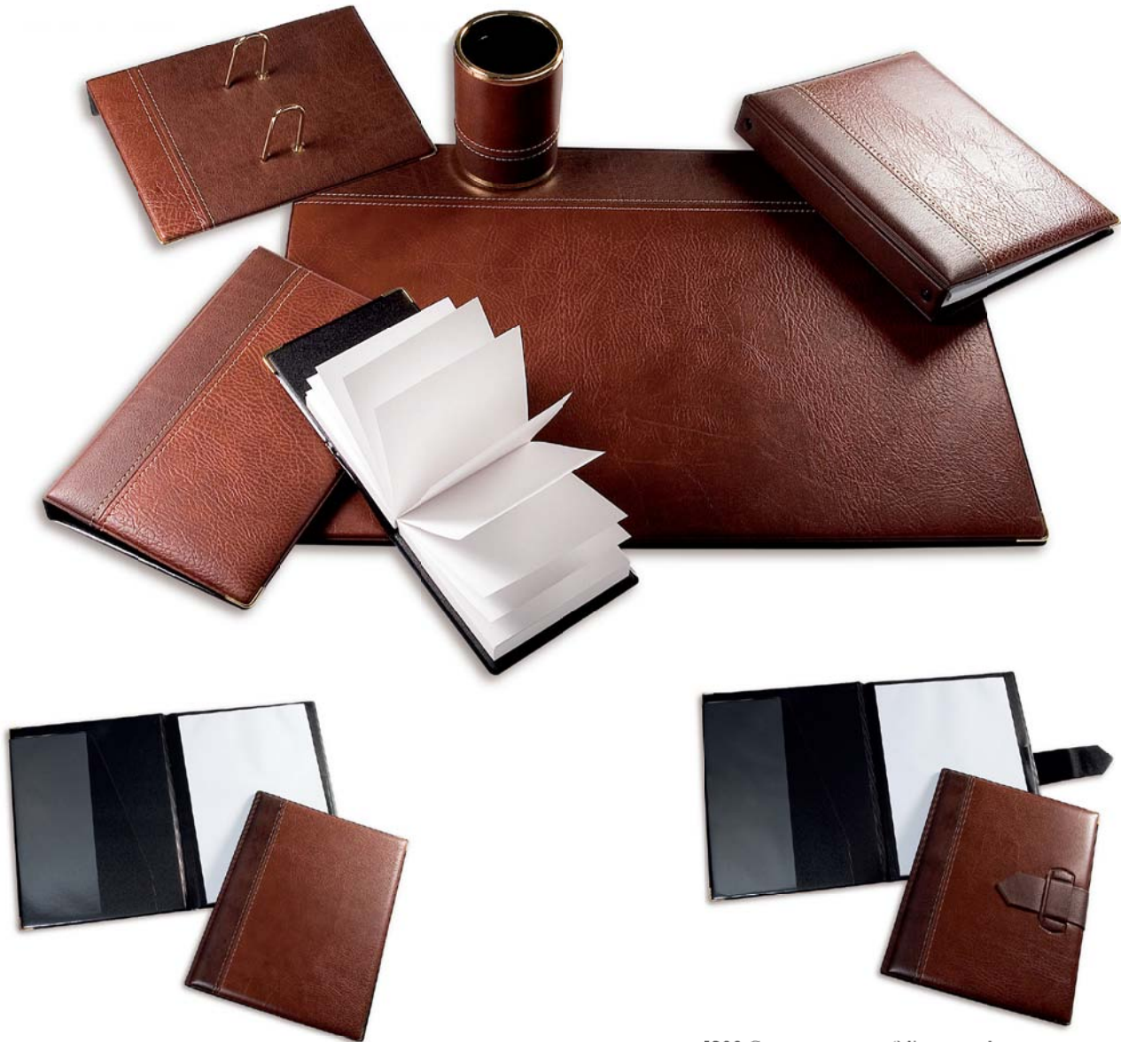
5201 Carpeta congreso folio sencilla.