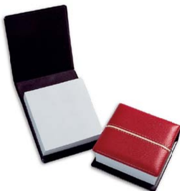
4031 Porta tacos "notas" sobremesa.