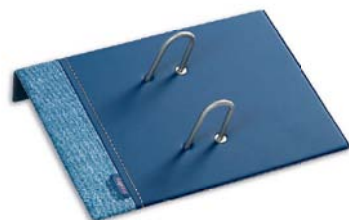
2127 Porta calendario.